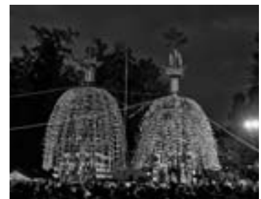
画像 平成二十四年 秩父祭笠鉾特別曳行