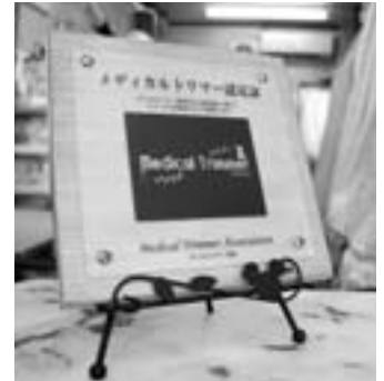
メディカルトリマー認定証

おかげさまで、ご利用いただいたお客様からはご好評をいただいております。当店は今年で33周年を迎える事が出来ました。